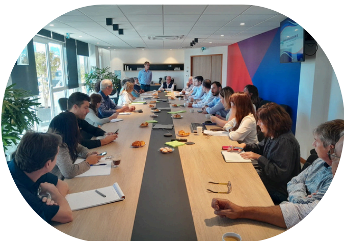
Petit-déjeuner du 17/07/2025 au MEDEF-NC