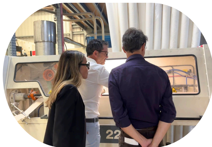
Visite de l'entreprise Vega le 23/09/2025